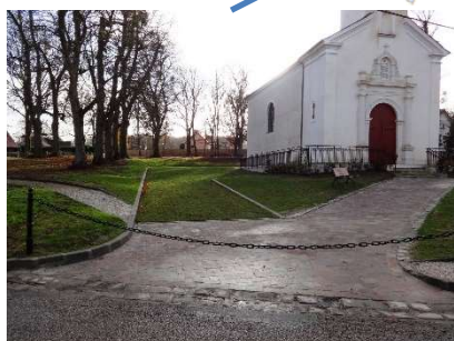
Sortie de l'église