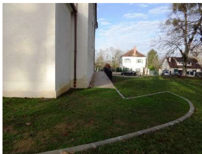
Rampe en béton désactivé