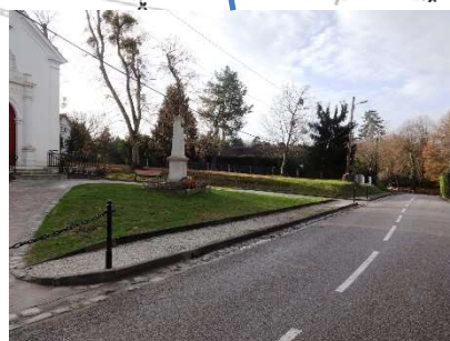
Monument au mort