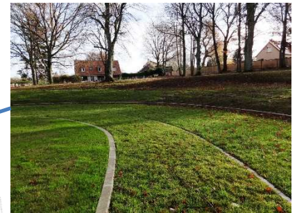
Voie circulaire et stationnement en dalles alvéolaires