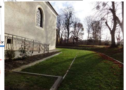
Rampe en béton désactivé