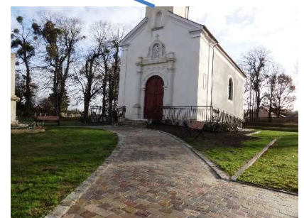
Entrée de l'église

Missions réalisées : AVP, PRO/DCE, VISA, DET, et AOR