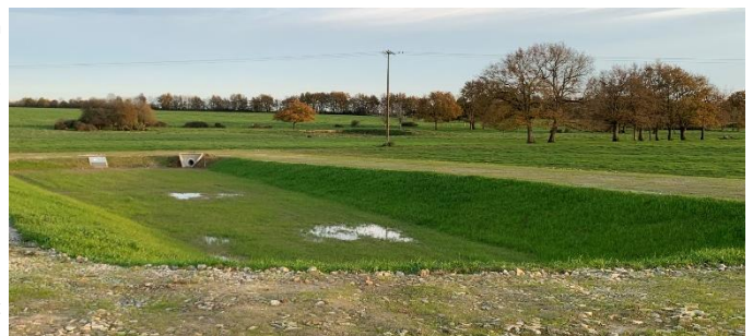
Bassin de rétention des eaux pluviales

Au Sud de la voie interne sera aménagé une aire de retournement en enrobé de 26mx24m afin de permettre le retournement des véhicules (poids-lourds...).