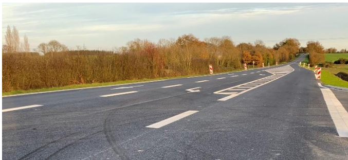
Tourne à gauche sur RD164