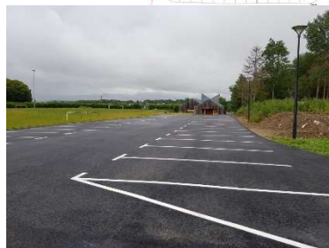
Vue du fond du parking