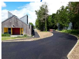
Entrée du parking