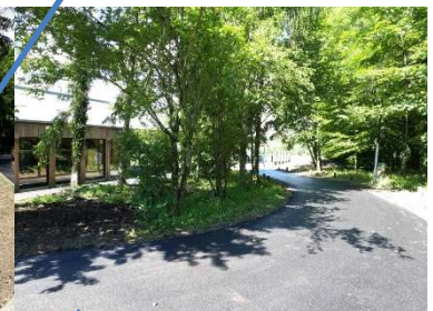
Entrée du parking