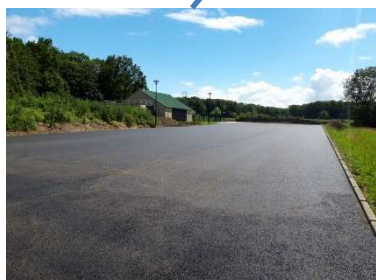
Parking avant marquage