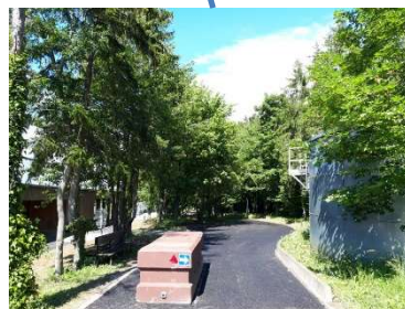
Bloc béton anti-intrusion