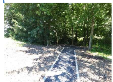
Allée vers les poubelles

Missions réalisées : I UPU, PRO, ACT, DET, et AOR